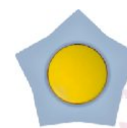
Naizmeni na sklopka Zvezda (žuto / svetlo plava) IEC 60669-1, IP 20

Broj artikla: 10AX/250V 16.42.005 (bezvij ana veza)