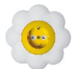
Dvopolna priključna nica sa zaštitnim elementom Cvet (žuto / beli) IEC 60884-1, CEE7 16A/250V; IP 20

Broj artikla: 16.32.052 (jezgro od polikarbonata)