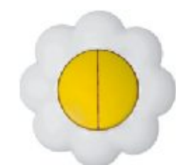
Serijska sklopka Cvet (žuto / beli) IEC 60669-1, IP 20

Broj artikla: 10AX/250V 16.32.004 (bezvij ana veza)