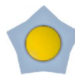
Jednopolna sklopka Zvezda (žuto / svetlo plava) IEC 60669-1, IP 20

Broj artikla: 10AX/250V 16.42.001 (bezvij ana veza)