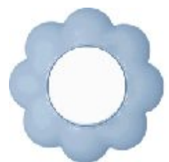
Jednopolna sklopka Cvet (belo / svetlo plavi) IEC 60669-1, IP 20

Broj artikla: 10AX/250V 16.36.001 (bezvij ana veza)