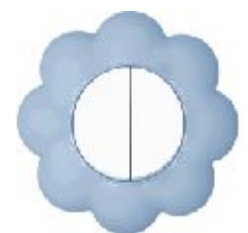
Serijska sklopka Cvet (belo / svetlo plavi) IEC 60669-1, IP 20

Broj artikla: 10AX/250V 16.36.004 (bezvij ana veza)