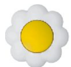
Jednopolna sklopka Cvet (žuto / beli) IEC 60669-1, IP 20

Broj artikla: 10AX/250V 16.32.001 (bezvij ana veza)