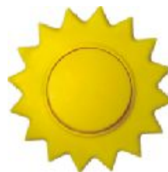
Naizmeni na sklopka Sunce IEC 60669-1, IP 20

Broj artikla: 10AX/250V 16.61.005 (bezvij ana veza)