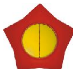
Serijska sklopka Zvezda (žuto / crvena) IEC 60669-1, IP 20

Broj artikla: 10AX/250V 16.41.004 (bezvij ana veza)