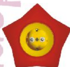
Dvopolna priključna nica sa zaštitnim elementom Zvezda (žuto / crvena) IEC 60884-1, CEE7 16A/250V; IP 20

Broj artikla: 16.41.052 (jezgro od polikarbonata)