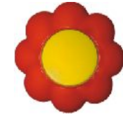
Naizmeni na sklopka Cvet (žuto / crveni) IEC 60669-1, IP 20

Broj artikla: 10AX/250V 16.33.005 (bezvij ana veza)