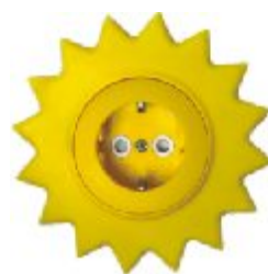
Dvopolna priključna nica sa zaštitnim elementom Sunce IEC 60884-1, CEE7 16A/250V; IP 20

Broj artikla: 16.61.052 (jezgro od polikarbonata)