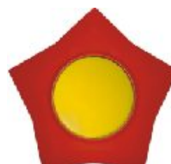
Naizmeni na sklopka Zvezda (žuto / crvena) IEC 60669-1, IP 20

Broj artikla: 10AX/250V 16.41.005 (bezvij ana veza)