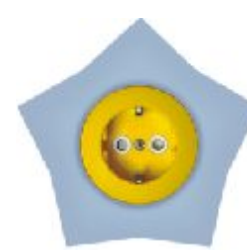
Dvopolna priključna nica sa zaštitnim elementom Zvezda (žuto / svetlo plava) IEC 60884-1, CEE7 16A/250V; IP 20

Broj artikla: 16.42.052 (jezgro od polikarbonata)