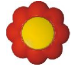
Jednopolna sklopka Cvet (žuto / crveni) IEC 60669-1, IP 20

Broj artikla: 10AX/250V 16.33.001 (bezvij ana veza)