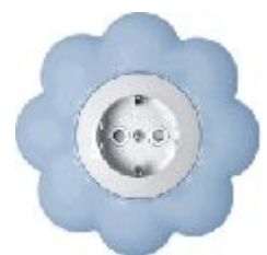
Dvopolna priključna nica sa zaštitnim elementom Cvet (belo / svetlo plavi) IEC 60884-1, CEE7 16A/250V; IP 20

Broj artikla: 16.36.052 (jezgro od polikarbonata)