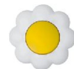
Naizmeni na sklopka Cvet (žuto / beli) IEC 60669-1, IP 20

Broj artikla: 10AX/250V 16.32.005 (bezvij ana veza)