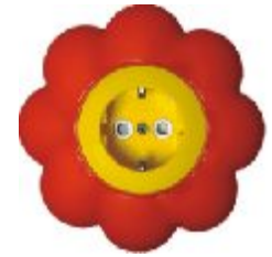
Dvopolna priključna nica sa zaštitnim elementom Cvet (žuto / crveni) IEC 60884-1, CEE7 16A/250V; IP 20

Broj artikla: 16.33.052 (jezgro od polikarbonata)