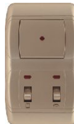
Vertikalna sklopka za kupatilo (zlatna) IEC 60669-1; IP 20 Sklopka: 10AX/250V; Pregibne sklopke: 16AX/250V