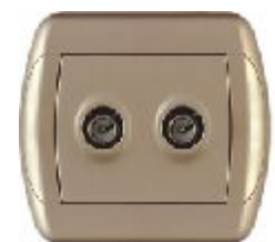
TV priključnica sa dva modula (zlatna) IEC 169-2; CEI EN 50083-1, -2, -4; Priključnik ak: antenski konektor IP 20

Broj artikla: 15.71.092 (prolazno / završna) 15.71.091 (završna)