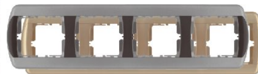
etvorostruki ukrasni okvir - horizontalni

Broj artikla: 15.72.363 (crno / srebrni) 15.71.363 (zlatni)