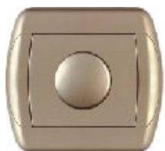
Elektronski regulator svetlosti sa potenciometrom (zlatna) (samo za sijalice sa užarenim vlaknom i halogene sijalice napona 230V~)

Broj artikla: 15.71.042 (230V; 60-550W) 15.71.142 (230V; 60-400W)