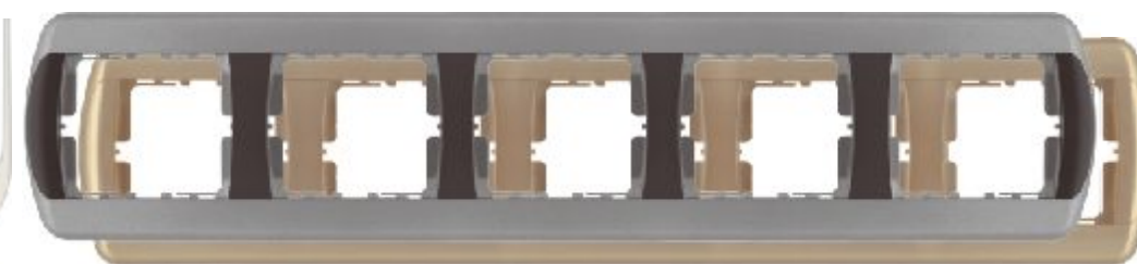
Petostruki ukrasni okvir - Horizontalni

Broj artikla: 15.72.364 (crno / srebrni) 15.71.364 (zlatni)