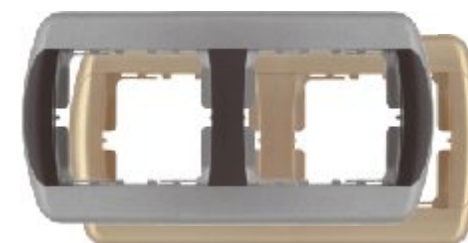
Dvostruki ukrasni okvir - horizontalni

Broj artikla: 15.72.361 (crno / srebrni) 15.71.361 (zlatni)