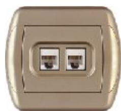
Komunikaciona priključnica RJ45 8/8 sa dva modula Cat6 (zlatna) IP 20