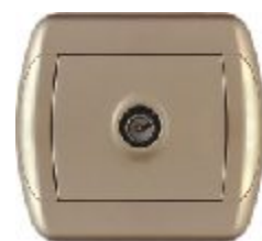
TV priključnica sa jednim modulom (zlatna) IEC 169-2; CEI EN 50083-1, -2, -4; Priključnik ak: antenski konektor IP 20

Broj artikla: 15.71.088 (prolazna) 15.71.090 (završna)