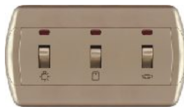
Horizontalna sklopka za kupatilo (zlatna) IEC 60669-1; IP 20 16AX/250V