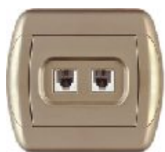
Telefonska priključnica RJ12 6/4 sa dva modula 623K (zlatna) IP 20