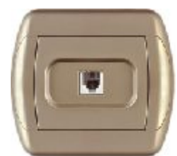
Telefonska priključnica RJ12 6/4 sa jednim modulom 623K (zlatna) IP 20