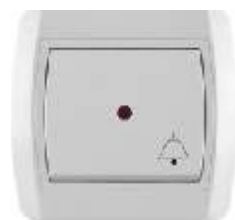
Taster zvona sa signalnom sijalicom IEC 60669-1, IP 20

Broj artikla: 10A/250V 14.01.010 (bezbij ana veza) 14.01.030 (vij ana veza) 16A/250V 14.01.630 (vij ana veza) Pakovanje: 20 kom.