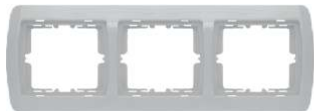
Trostruki ukrasni okvir - horizontalni