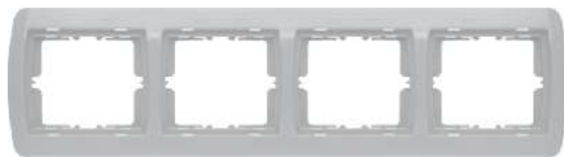
etvorostruki ukrasni okvir - horizontalni