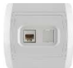
Komunikaciona priklju nica RJ45 8/8 sa jednim modulom Cat6 IP 20

Broj artikla: 14.01.072 Pakovanje: 24 kom.