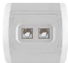
Telefonska priklju nica RJ12 6/4 sa dva modula 623K IP 20

Broj artikla: 14.01.071 Pakovanje: 24 kom.