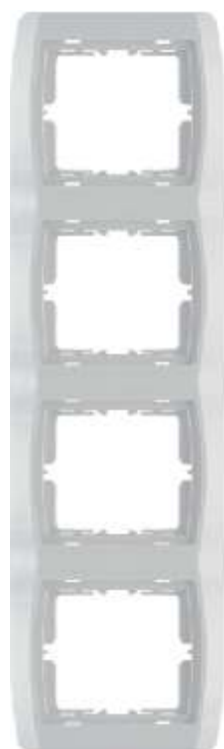
etvorostruki ukrasni okvir - vertikalni