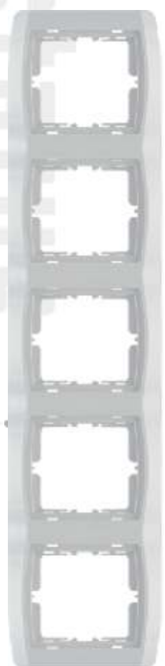
Petostruki ukrasni okvir - vertikalni