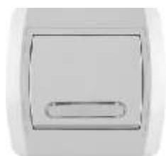
Taster sa ploicom za natpis sa signalnom sijalicom IEC 60669-1, IP 20

Broj artikla: 10A/250V 14.01.012 (bezbij ana veza) 14.01.032 (vij ana veza) 16A/250V 14.01.632 (vij ana veza) Pakovanje: 20 kom.