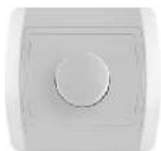
Elektronski regulator svetlosti sa potencijetrom (samo za sijalice sa užarenim vlaknom i halogene sijalice napona 230V-)

Broj artikla: 14.01.092 (prolazno / završna) 14.01.091 (završna) Pakovanje: 24 kom.