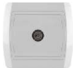
TV priklju nica sa jednim modulom IEC 169-2; CEI EN 50083-1, -2, -4; Priklju ak: antenski konektor IP 20

Broj artikla: 14.01.078 Pakovanje: 24 kom.