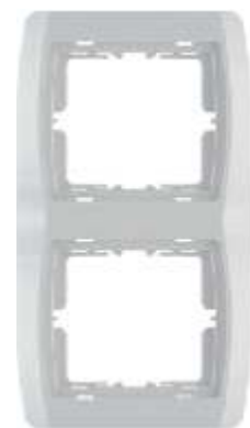
Dvostruki ukrasni okvir - vertikalni