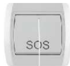
Potezni taster SOS IEC 60669-1, IP 20

Broj artikla: 10A/250V 14.01.015 (bezbij ana veza) 14.01.035 (vij ana veza) 16A/250V 14.01.635 (vij ana veza) Pakovanje: 20 kom.