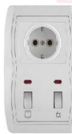
Vertikalna sklopka za kupatilo sa dvopolnom priklju nicom IEC 60669-1; IP 20 Priklju nica: 16A/250V (jezgro od keramike) Pregibne sklopke: 16AX/250V

Broj artikla: 14.01.099 Pakovanje: 7 kom.