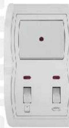
Vertikalna sklopka za kupatilo IEC 60669-1; IP 20 Sklopka: 10AX/250V Pregibne sklopke: 16AX/250V

Broj artikla: 14.01.042 (230V; 60-550W) 14.01.142 (230V; 60-400W) Pakovanje: 16 kom.