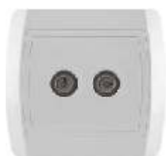
TV priklju nica sa dva modula IEC 169-2; CEI EN 50083-1, -2, -4; Priklju ak: antenski konektor IP 20

Broj artikla: 14.01.088 (prolazna) 14.01.090 (završna) Pakovanje: 24 kom.