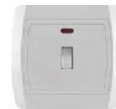
Jednopolna sklopka sa preklopnikom i signalnom sijalicom IEC 60669-1, IP 20

Broj artikla: 10A/250V 14.01.020 (bezbij ana veza) 14.01.040 (vij ana veza) Pakovanje: 20 kom.