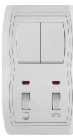
Vertikalna sklopka za kupatilo sa serijskom sklopkom IEC 60669-1; IP 20 Sklopke: 10AX/250V Pregibne sklopke: 16AX/250V

Broj artikla: 14.01.096 Pakovanje: 7 kom.