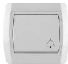
Taster zvona IEC 60669-1, IP 20

Broj artikla: 10A/250V 14.01.010 (bezbij ana veza) 14.01.030 (vij ana veza) 16A/250V 14.01.630 (vij ana veza) Pakovanje: 20 kom.