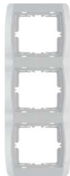
Trostruki ukrasni okvir - vertikalni