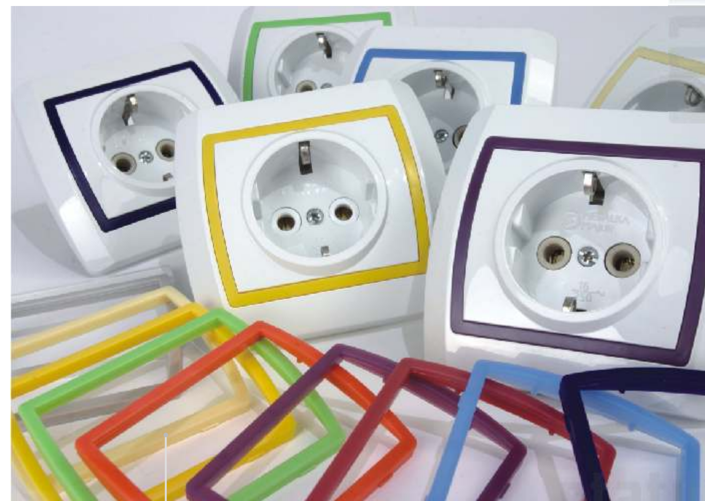
Uklonni okviri u boji