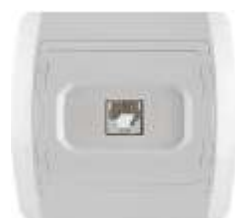
Telefonska priklju nica RJ12 6/4 sa jednim modulom 623K IP 20

Broj artikla: 10A/250V 14.01.018 (bezbij ana veza) 14.01.038 (vij ana veza) 16A/250V 14.01.638 (vij ana veza) Pakovanje: 20 kom.