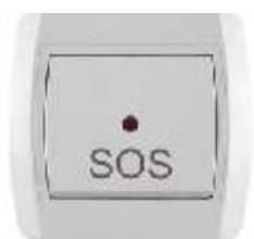
Taster SOS sa signalnom sijalicom IEC 60669-1, IP 20

Broj artikla: 10A/250V 14.01.017 (bezbij ana veza) 14.01.037 (vij ana veza) 16A/250V 14.01.637 (vij ana veza) Pakovanje: 20 kom.