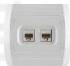
Komunikaciona priklju nica RJ45 8/8 sa dva modula Cat6 IP 20

Broj artikla: 14.01.095 Pakovanje: 7 kom.