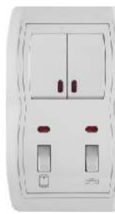
Vertikalna sklopka za kupatilo sa serijskom sklopkom i signalnim sijalicama IEC 60669-1; IP 20 Sklopke: 10AX/250V Pregibne sklopke: 16AX/250V

Broj artikla: 14.01.097 Pakovanje: 7 kom.