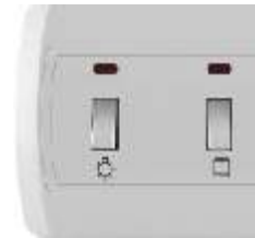
Horizontalna sklopka za kupatilo IEC 60669-1; IP 20 16AX/250V

Broj artikla: 14.01.077 Pakovanje: 24 kom.