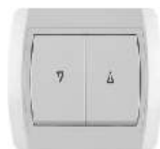
Taster za roletne IEC 60669-1, IP 20

Broj artikla: 10A/250V 14.01.018 (bezbij ana veza) 14.01.038 (vij ana veza) 16A/250V 14.01.638 (vij ana veza) Pakovanje: 20 kom.